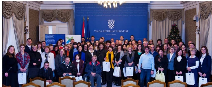
22.12.2014. Potpisivanje ugovora o sufinanciranju za ESF projekt