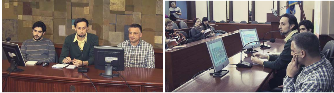
26.2.2014. Tribina „ Slušam – Čujem. Gledam – Vidim. Znam – Djelujem “