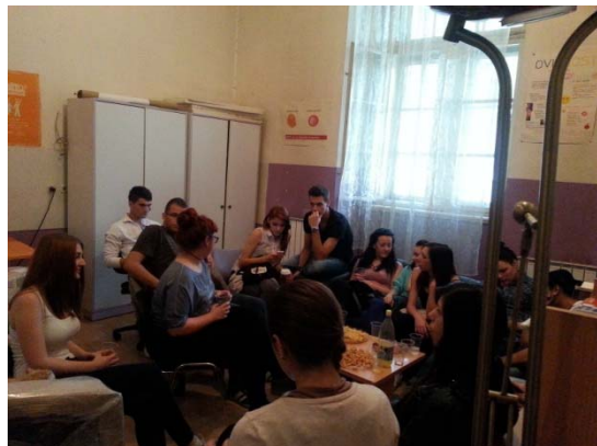
28.6.2014. Obilježavanje Međunarodnog dana borbe protiv droga u Savjetovalištu udruge