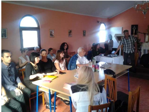
18.9.2014. 8. Nacionalni susret o beskućnicima u Karlovcu