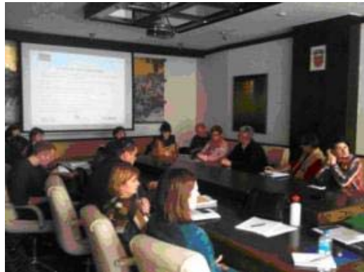
25.4.2014. Održana fokus grupa u sklopu projekta Housing First