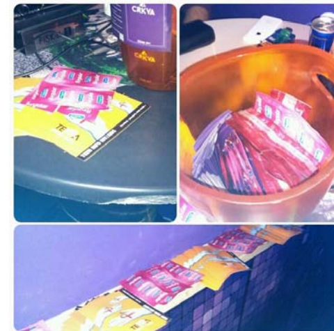
17.10.2014. Terrini volonteri u akciji dijeljenja kondoma u noćnom klubu Crkva