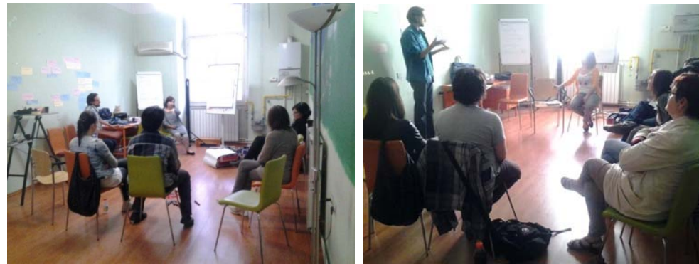
21.-22.05.2014. Strateško planiranje udruge Terra