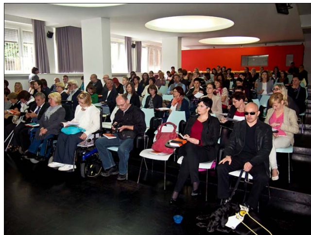
25.9.2014. Konferencija „Društveni utjecaj organizacija civilnog društva u RH“