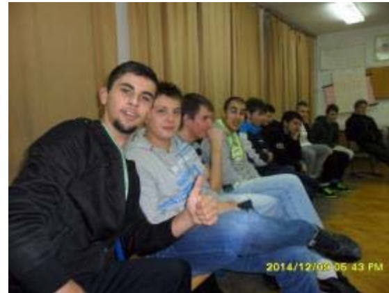
12.9.2014. Radionice u domu Željezničke tehničke škole Moravice