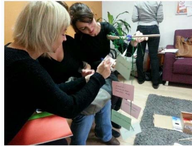
14. i 28.11.2014. Edukacija „Grupni rad sa djecom i mladima s poremećajima u ponašanju“