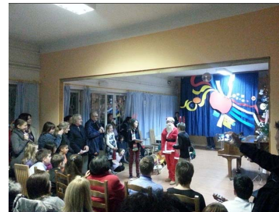
16.12.2014. Tradicionalna božićna predstava u dječjem domu Izvor u Selcu