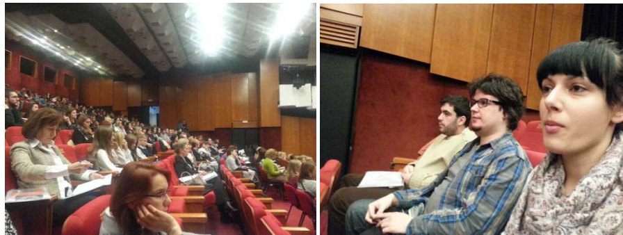
20.11.2014. Opatija, II. Simpozij Koraci za budućnost bez nasilja - Nasilje i mladi